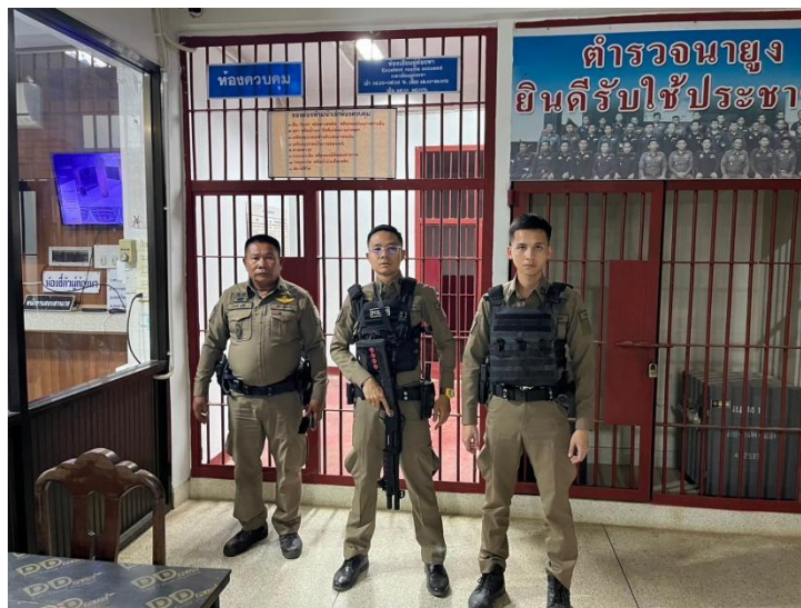
ภาพถ่ายร้อยละ ๒๐ สแกน QR CODE ตรวจสอบห้องควบคุมผู้ต้องหาพร้อมถ่ายภาพ